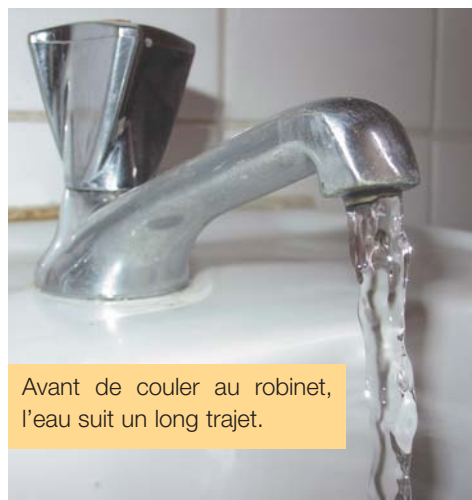
Avant de couler au robinet, l'eau suit un long trajet.

A Quimperlé, ce réseau est composé de 63 kilomètres de canalisations gravitaires