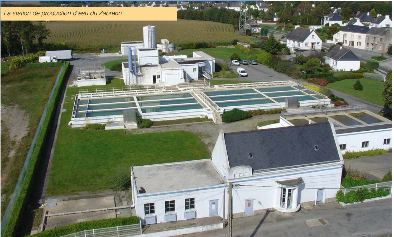
La station de production d'eau du Zabrenn

D' où vient l'eau qui coule de votre robinet ? Tout simplement de stations de pompage situées aux Gorrêts sur l'Ellé et en amont des Papeteries De Mauduit sur l'Isole. Grâce à elles, Quimperlé est alimentée en eau. En effet, l'eau prélevée dans les rivières est envoyée à l'usine du Zabrenn afin de la rendre potable selon les exigences de la directive européenne de novembre 1998 et du décret du 20 décembre 2003.