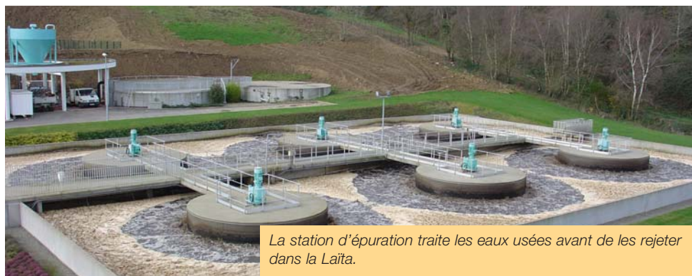
La station d'épuration traite les eaux usées avant de les rejeter dans la Laïta.

L'eau distribuée a présenté une bonne qualité bactériologique et a été conforme aux limites de qualité pour les autres paramètres recherchés.