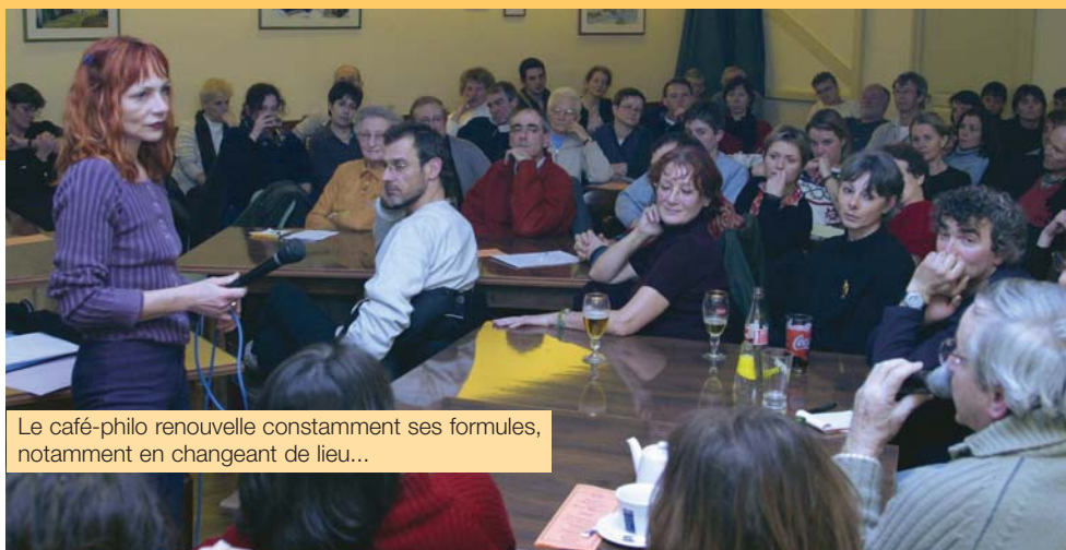
Le café-philo renouvelle constamment ses formules, notamment en changeant de lieu...

Soixante-neuf rencontres plus tard, le café-philo est un véritable succès. Le pari n'était pourtant pas gagné d'avance ! En effet, il n'est pas toujours facile d'attirer les foules avec la philosophie. Et si le café-philo marche bien, c'est surtout parce qu'il a pour vocation de susciter le