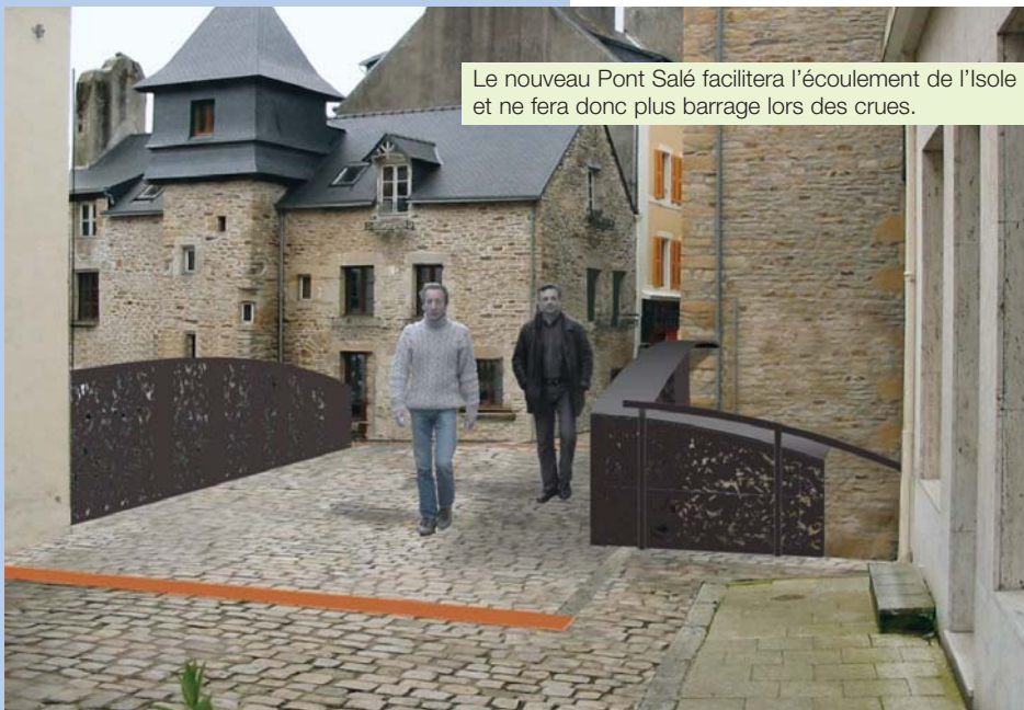
Le nouveau Pont Salé facilitera l'écoulement de l'Isole et ne fera donc plus barrage lors des crues.

À compter du mois d'avril 2005, une phase importante de travaux sur l'Isole va débuter. Ceux-ci ont pour but d'améliorer la lutte contre les risques d'inondations. Voici comment les choses vont se dérouler au cours des mois à venir.