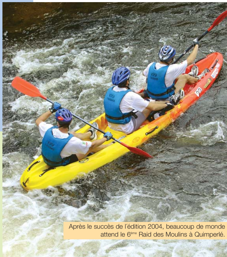
Après le succès de l'édition 2004, beaucoup de monde attend le 6 ème Raid des Moulins à Quimperlé.

Et l'avenir, c'est déjà aujourd'hui. En effet, le 6 ème raid quimperlois pointe déjà le bout de son nez. Les dossiers d'inscription sont disponibles depuis le 1 er mars. Et si l'on s'en réfère à l'année dernière, il ne faudra pas traîner pour s'inscrire. Le nombre de places est, en effet, toujours limité à 100 équipes de trois personnes. Si l'on ne change pas une formule qui marche, on n'hésite pas à la faire évoluer. Les épreuves incontournables telles que le VTT, le trail ou le canoë sont toujours au programme. Le tout en orientation bien sûr.