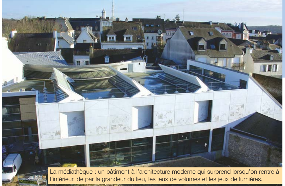
La médiathèque : un bâtiment à l'architecture moderne qui surprend lorsqu'on rentre à l'intérieur, de par la grandeur du lieu, les jeux de volumes et les jeux de lumières.

Dès le 9 avril, la médiathèque de Quimperlé vous propose une multitude de documents destinés à l'éducation, aux loisirs et à l'information de la population. Elle met également en place des actions d'animation ou de formation qui visent à promouvoir l'écrit, l'image, la musique et l'accès aux nouvelles technologies de l'information et de la communication.