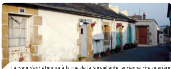
La zone s'est étendue à la rue de la Surveillante, ancienne cité ouvrière.

Afin d'aider les Quimperlois dans ces démarches, une permanence a lieu toutes les 3 semaines au service urbanisme de la ville. L'Architecte des Bâtiments de France conseille et oriente les demandeurs sur le choix architectural, en vue d'assurer la cohérence avec le patrimoine existant et en assurer la protection.